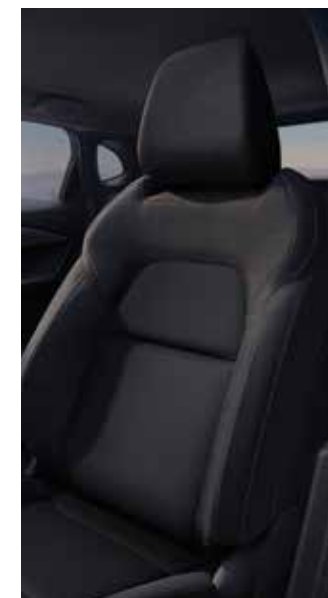
Elite & Premium