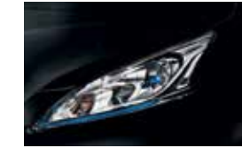
Black (M) - GNO (EVALIA & VAN)