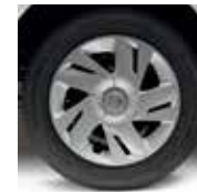
15" STEEL COVER (EVALIA & VAN)