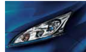
Blue (P) - BW9 (EVALIA)