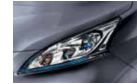
Light Grey (PM) - K51 (EVALIA & VAN)