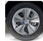
15" ALLOY (EVALIA & VAN)