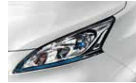
White (S) - QM1 (EVALIA & VAN)