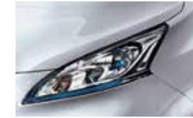
Silver (M) - KLO (EVALIA & VAN)