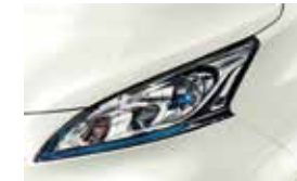
White (3P) - QAB (EVALIA)