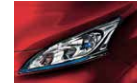
Red (S) - Z10 (EVALIA & VAN)