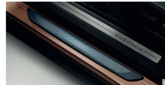
D - ΦΩΤΙΖΟΜΕΝΑ ΠΡΟΣΤΑΤΕΥΤΙΚΑ ΕΙΣΟΔΟΥ Με υπογραφή ARIYA.

Εύκολα στο καθάρισμα, βοηθούν στην προστασία του αυτοκινήτου σας από γρατζουνιές και λοιπές φθορές.