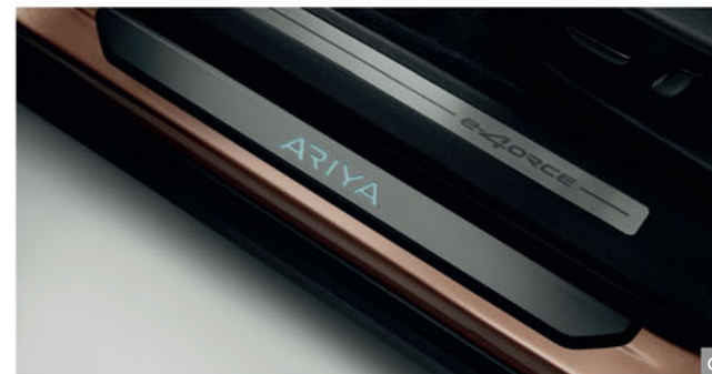
C - PREMIUM ΦΩΤΙΖΟΜΕΝΑ ΠΡΟΣΤΑΤΕΥΤΙΚΑ ΕΙΣΟΔΟΥ Με λογότυπο ARIYA.

Διατηρήστε την καμπίνα του ARIYA σαν καινούρια με τη σειρά αξεσουάρ προστασίας εσωτερικού.